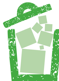
T.19. Utställning av container för restavfall

Utställning av container (alla typer) kan beställas av Förbundet som tillhandahåller behållaren. Placering ska alltid godkännas av Förbundet. För hyra av container kontakta VafabMiljös kundservice för prisuppgift. (Se tabell T.19 och T.20)