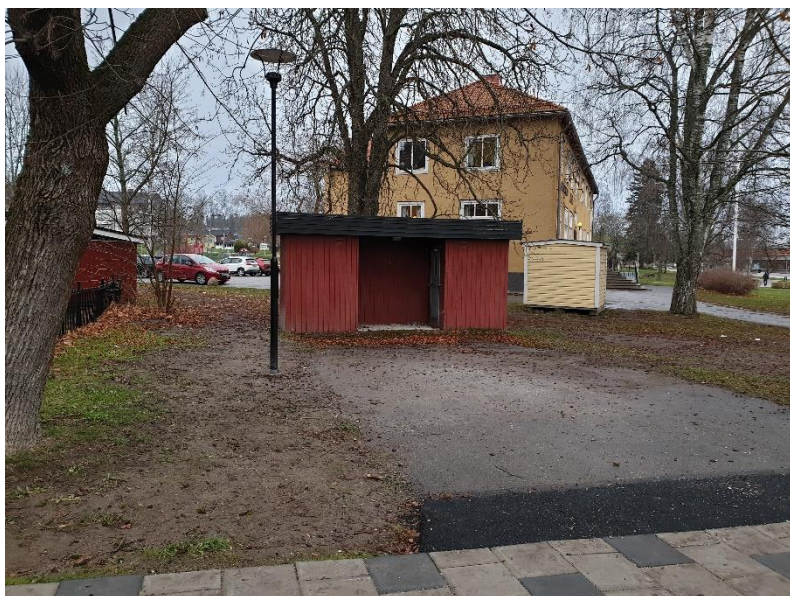
Befintlig toalett vid klockstapeln i Vilhelminaparken som föreslås ersättas med en ny självrengörande toalett.