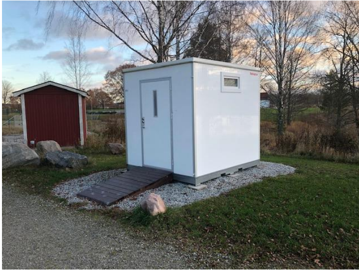
Toalett vid Simbadet