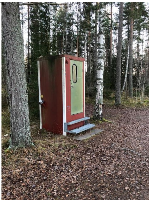
Till vänster: Befintlig toalett uppställd vid badplats i Hedkärra. Till höger: Befintlig toalett uppställd vid Ängelsbergbadet